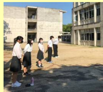
↓ 医進クラス開講式の様子

しかし、その間に生徒会は、学校再開後にどのような活動ができるのかを検討してきました。学校が再開され、2週間後に挨拶運動を始めました。この活動を通して、新型コロナウイルス感染症に負けない、明るく活気のある学校をつくりたいです。