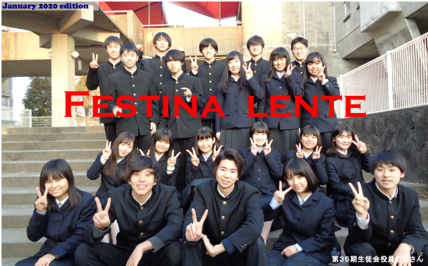
第35期生徒会役員皆さん