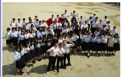
↑ 帰国した留学生3名と記念撮影

【7/26,30】6-4がAPU春semester第2クォーターの期末試験を受験しました。