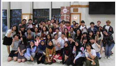
↑ 海外高校生と交流 (6-4)