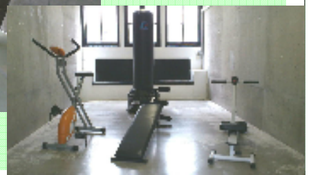
↓トレーニングルーム