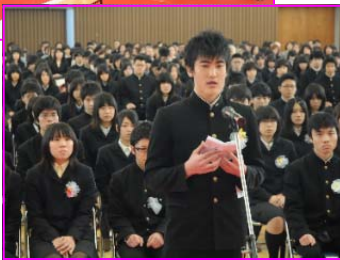
(写真は昨年の卒業式)