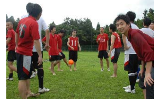
(写真は昨年の夏季研修です)