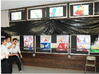
クラス展示 2年3組 ← 第1位