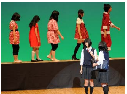
25回生の集大成！ 高2 演劇『真夏のサンタクロース』