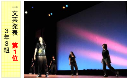
→ 文芸発表 3年3組 第1位

入生は茶道を体験しました。 また、この日は生徒は私服登校許可日でもあります。これはイベントなどに参加すると衣服が汚れるが、前日が体育大会であるため体操服も洗濯中…ということで、学校は華美にならない服装という条件でこの日のみ許可をしています。学園祭オリジナルのTシャツやポロシャツを着た生徒が学園祭を盛り上げていました。