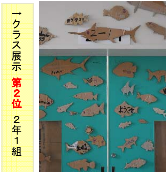
→ クラス展示 第2位 2年1組