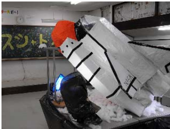
クラス展示 1年2組 ← 第3位