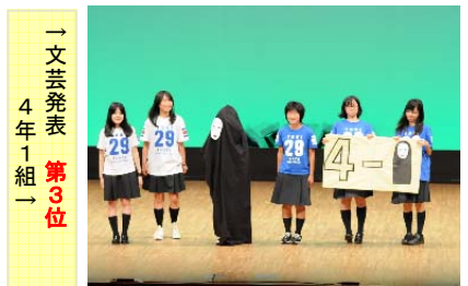
→ 文芸発表 4年1組 第3位